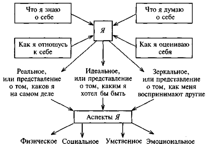
Рис. 2. Структура Я-концепции

ее характерные особенности. Схематически структуру Я-концепции можно изобразить следующим образом (рис. 2):